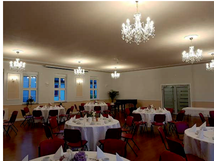
Begegnungs- und Tagungszentrum Michelsberg